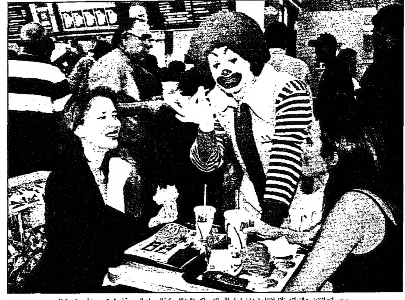
مخرج برنامج التثقيف من الزبائن خلال افتتاح فرع اخر لسلسلة مطاعم ماكدونالدز الامريكية للوجبات السريعة في شرق بيروت

بيروت- من مايكل جورجى: قال مسؤول بشركة ماكدونالدز للعمليات السريعة ان الشركة العملاقة تعزز افتتاحها في الشرق الاوسط سنوياً.